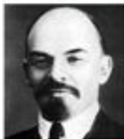
V. Lenin Soviet Premier