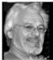
H. Pensonjki Censuurcommissie