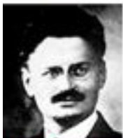
L. Trotsky Commissar Red Army