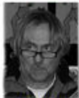
J. Vinkovitsj Rode Brigade