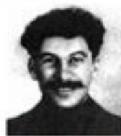
J. Stalin General Secretary