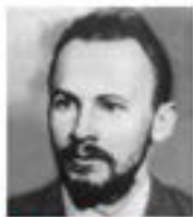
N. Bukharin Politburo